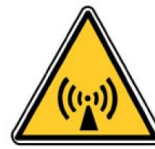
Rayonnement non ionisant

formation et la du personnel viennent notamment par zones de travail où les exposés à des champs