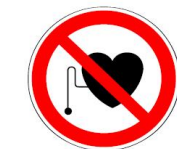
Entrée interdite aux porteurs d'implant actif